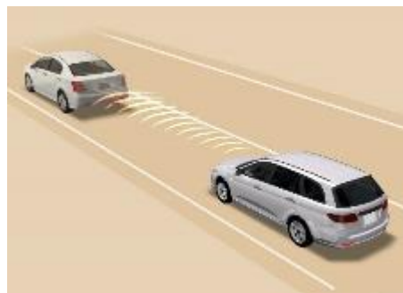
全車速アダプティブクルーズコントロール