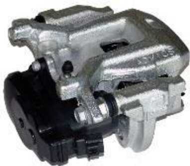
キャリパー一体式電動パーキングブレーキ

電動パーキングブレーキは、シフトレバーやアクセル操作に連動し、自動でパーキングブレーキを作動させることができます。全車速アダプティブクルーズコントロールや、ブレーキホールド機能での長時間停車保持を可能とし、ドライバーの負担を軽減します。